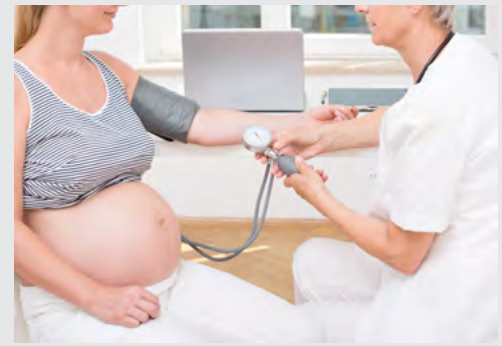
Im Rahmen der Vorsorgeuntersuchung für Schwangere kann Bluthochdruck rechtzeitig festgestellt und behandelt werden.

Mit zunehmendem Alter bauen die Muskeln ab, mit etwa 50 Jahren lassen zudem Balance, Beweglichkeit und Ausdauer deutlich nach. Dadurch steigt die Gefahr von Stürzen. Etwa ein Drittel der Senioren über 65 Jahre stürzt mindestens einmal in zwei Jahren, bei Pflegebedürftigen in dieser Altersklasse liegt die Zahl deutlich höher. „Viele Ursachen für einen Sturz kann