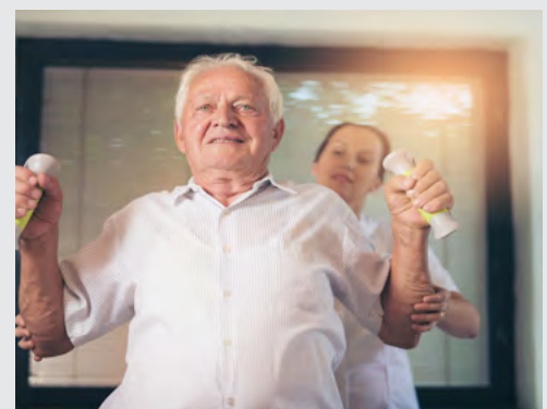
Regelmäßiges Training kann helfen, Stürze zu vermeiden, und die eigene Unabhängigkeit möglichst lange beizubehalten.