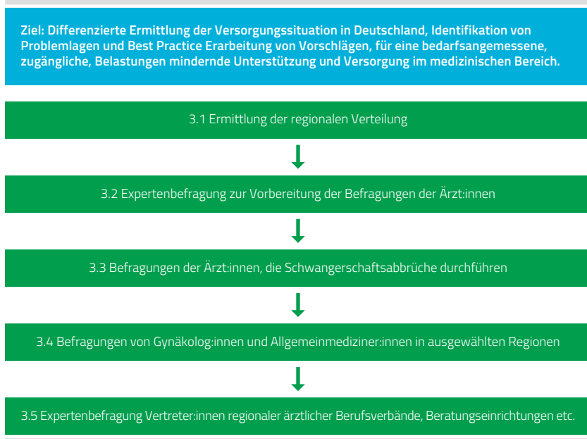
Abbildung 3: Untersuchung der medizinischen Versorgungssituation bei Schwangerschaftsabbruch (Hochschule Fulda)

Die Hochschule Fulda verantwortet den gesamten Untersuchungsteil zur medizinischen Versorgung (im Rahmen von Arbeitspaket 3). Dies geschieht auf fünf unterschiedlichen Wegen.